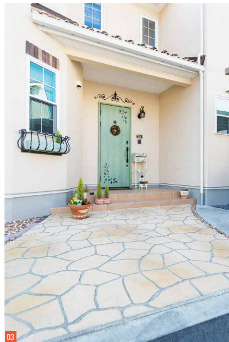
02. 自然光がたっぷり降り注ぐリビングダイニングは、家族が集う場所。アーチにはレンガ風の装飾を施し、趣きをプラス。随所に職人の技と遊び心が溢れている 03. 淡いグリーンがポイントの玄関。ご夫妻のアイデアと担当者のアドバイスによって二人三脚で家づくりを進めていった 04. 階段には植物などをディスプレイ。部屋の至る所に小物などが飾られた空間はご夫妻のセンスが光り、カフェのようなお洒落な空間に