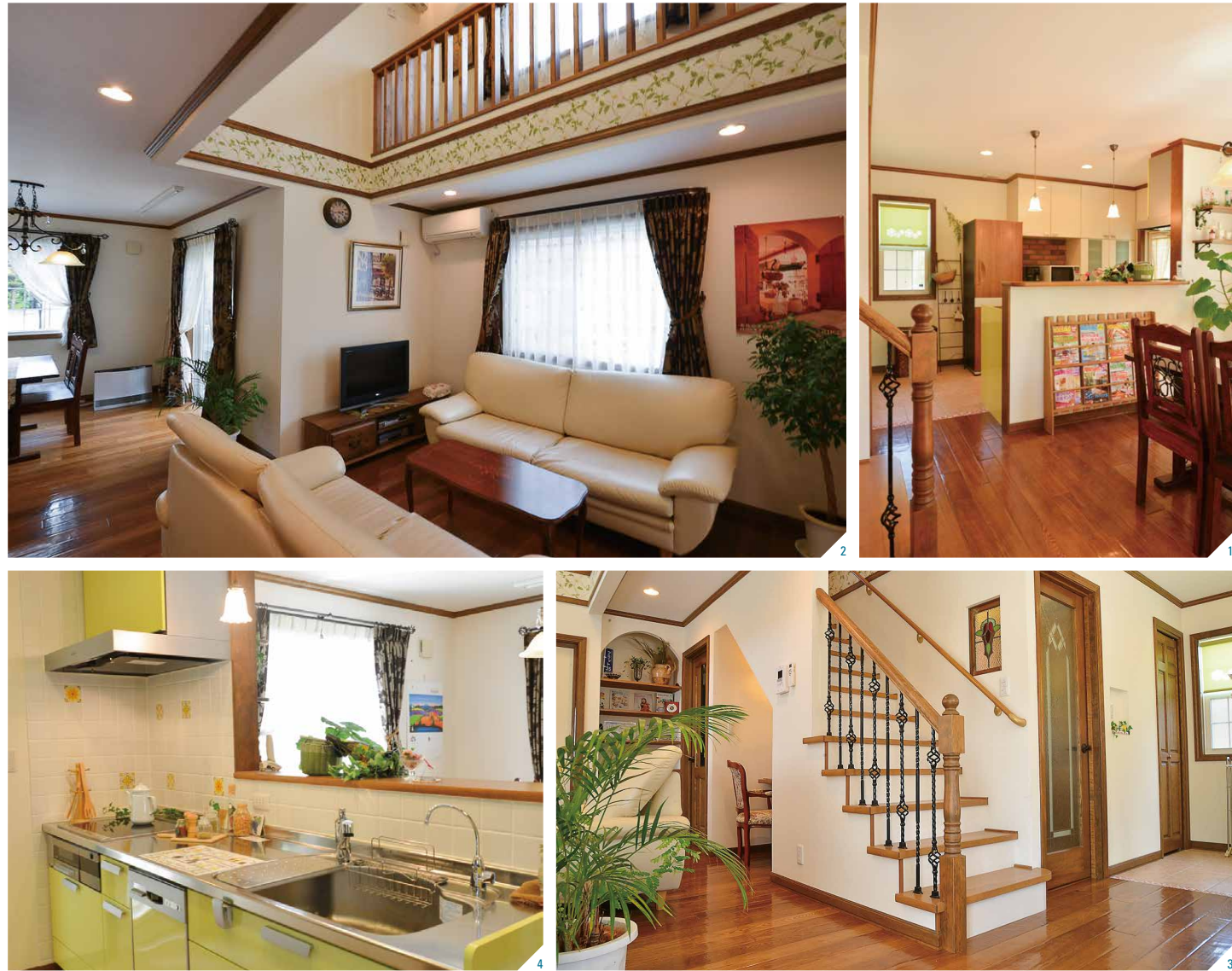
1.1000万円台で暮らしやすさと飽きのこない質感を重視する同社の家づくり。多様な輸入住宅を全国規模で提供しているだけに提案力も高い 2!リビング上の吹き抜けは、南側にキャットウォークを配し、部屋干しのスペース等にも活用する 3.オリジナルのアイアン手摺とアンティークフロアが美しさを際立たせる 4.グリーンカラーのキッチン。格子入りタイプのサッシ、木製の内窓枠など標準で高性能な仕様が魅力