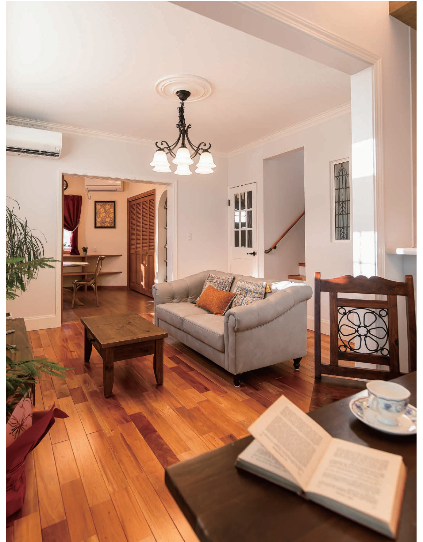
ダイニングからリビングを望む。ビクトリアンスタイルをテーマに、モールディングや巾木、シャンデリアを引き立てるメダリオンなど、細部の装飾にもこだわり、優雅さが薫る。床に採用したのはマホガニー。深い金赤色の光を放ち、様式美を引き立てる