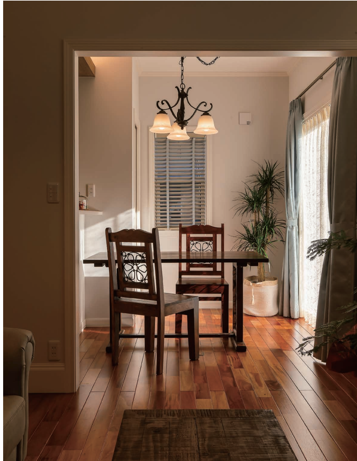
キッチンの前、東側に設けたダイニング。キッチンとは天井高を変えて開放感を演出したほか、段差に仕込んだ間接照明が夕食の団らんを温かく照らす。アンティーク調のダイニングテーブルやチェア、ペンダントライトが優美な空間を引き立てる