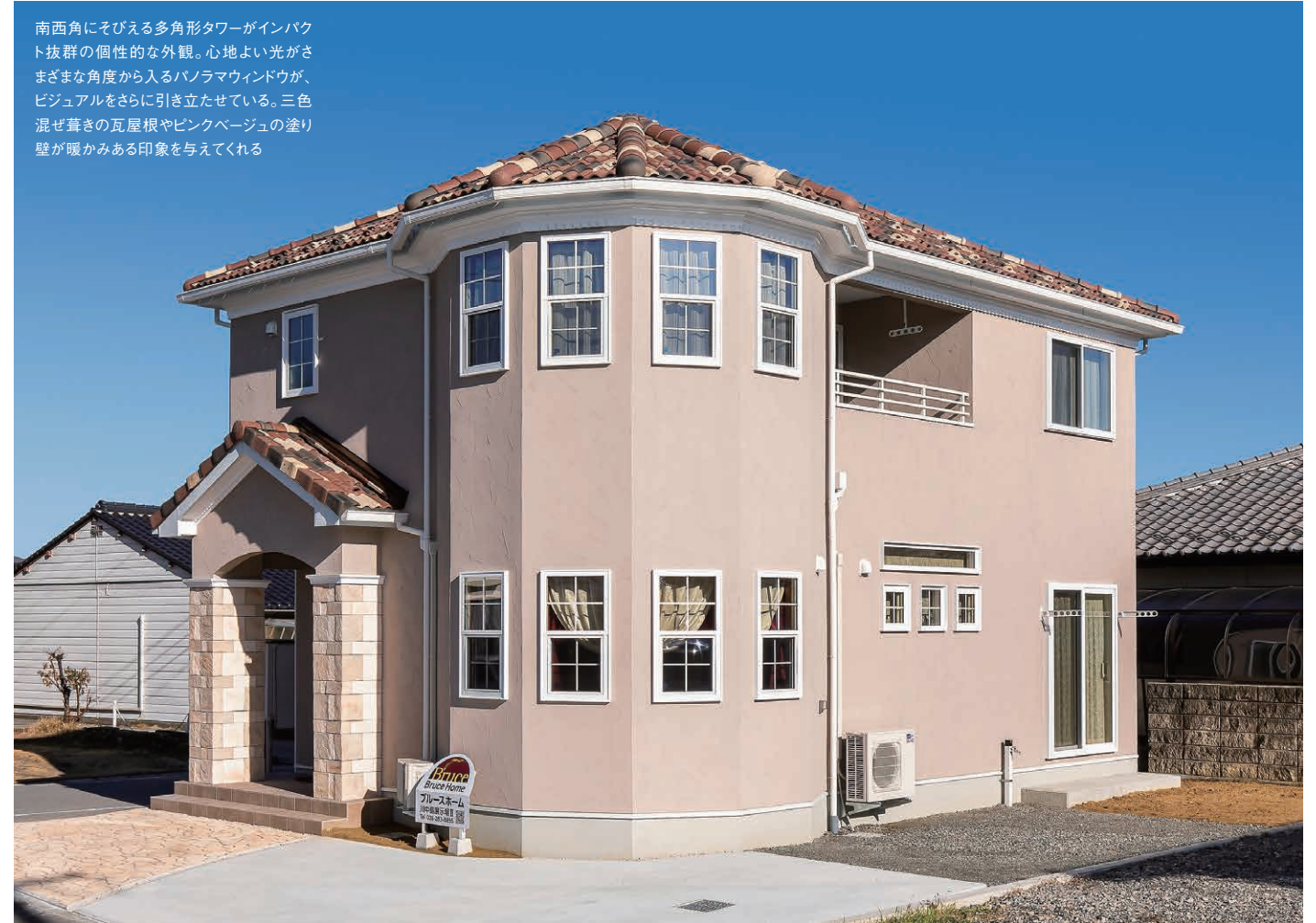
南西角にそびえる多角形タワーがインパクト抜群の個性的な外観。心地よい光がさまざまな角度から入るパノラマウィンドウが、ビジュアルをさらに引き立たせている。三色混ぜ葺きの瓦屋根やピンクベージュの塗り壁が暖かみある印象を与えてくれる

1.家族がゆったり過ごすセカンドリビングをイメージして設計された、パノラマウィンドウのある多角形の空間。日当たりのいい南側で、住まい手の個性に合わせて演出は自由自在。引き込み戸を閉めると個室になり、来客の際や、趣味の部屋、リモートワーク室など多目的に使える 2.パノラマ部屋とリビングの間には垂れ壁があり、プライベート感が生まれ落ち着いた過ごせる 3.リビングのアクセントとなっている3つ並んだ格子窓。モリスの壁紙の下には吸放湿・防臭効果のあるエコカラットタイルを張り、機能性も高めた 4.クラシカルな雰囲気シャンデリアで華やかさをプラス