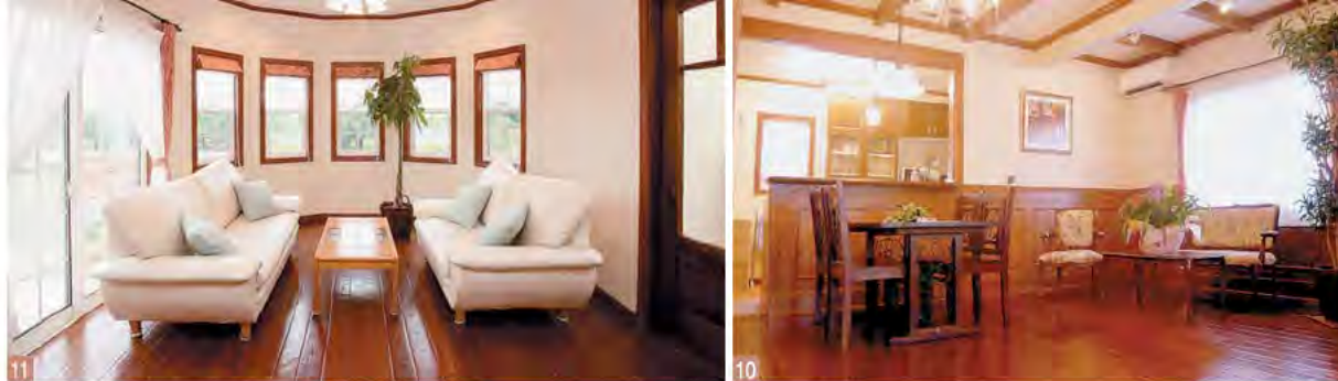
10.照明にはヨーロッパ伝統のロートアイアのランプを使用 11.リビングには開放的なパノラマウィンドー。柔らかな光が降り注ぎ、ゆっくりとできる 12.タイル使いが南仏らしさを醸し出すキッチン 13.日の光が差し込む明るく広い寝室 14.石積みのアーチとアンティーク調の重厚な玄関ドア※10~14番はモデルハウスの内観写真