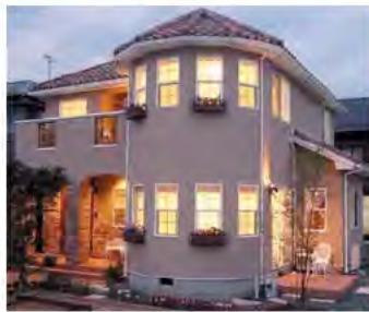
宮田工業 長野 検索

ショールームに1度見学に行ってみてはどうだろうか 太陽と風がよく似合う南仏プロヴァンス風のモデルハウス。リビングの開放的なパノラマウィンドーからは柔らかな光が降り注ぐ。また日差しが差し込む明るく広い寝室やタイル使いが南仏らしさを醸し出すキッチンなど、憧（あこが）れていたライフスタイルを実現するためにも1度ショールームに見学に行ってみてはどうだろうか。