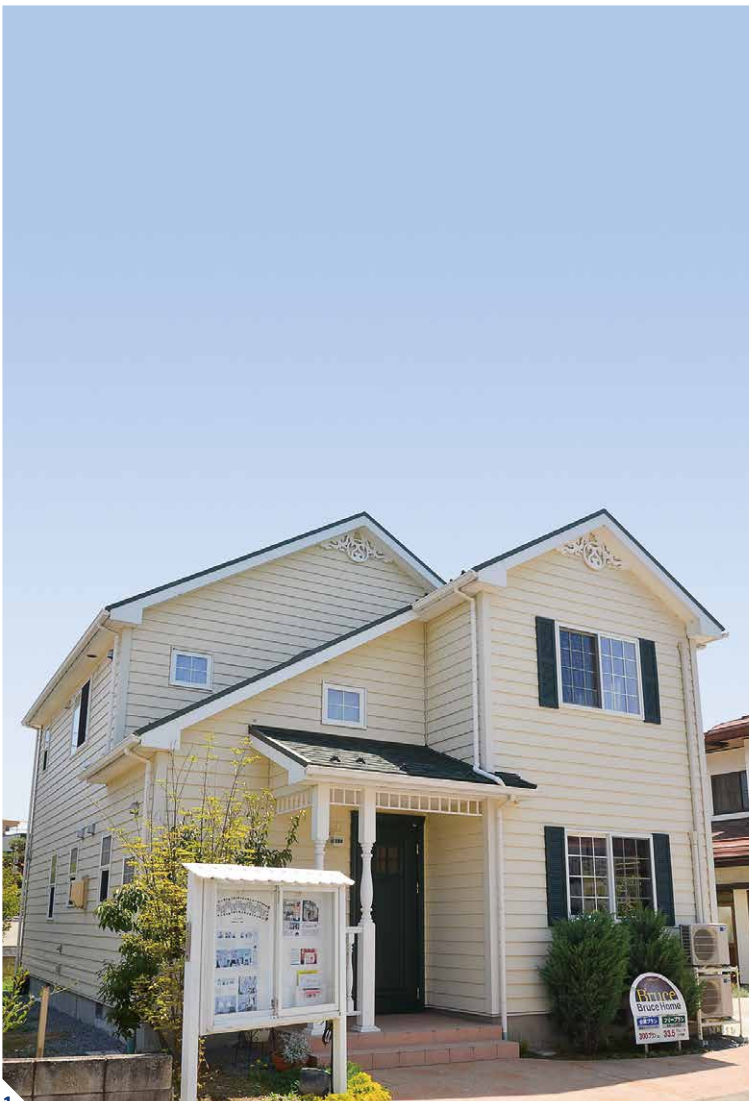
【長野市稲里モデルハウス】1.人気のオレゴンシリーズをベースとしたモデルハウス。英国の住まいをルーツとする北米スタイルと威風堂々とした佇まいはあたたかさに包まれたテイスト。グリーン屋根と質感の高いラップサイディングは一見の価値あり 2.オリジナルのアイアン手摺とアンティークフロアが美しさを際立たせる。写真奥へつながる和室はブルースエコウォールなる吸湿に優れた壁材仕立て 3.キッチンがグリーンカラーをセレクト。格子入りタイプのサッシ、木製の内窓枠など標準で高性能な仕様が魅力