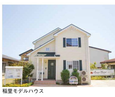
稲里モデルハウス

「デザイン性と機能性を考えてある間取りになっております。可愛いインテリアも沢山ありますので、是非モデルハウスにお出かけ下さい!」