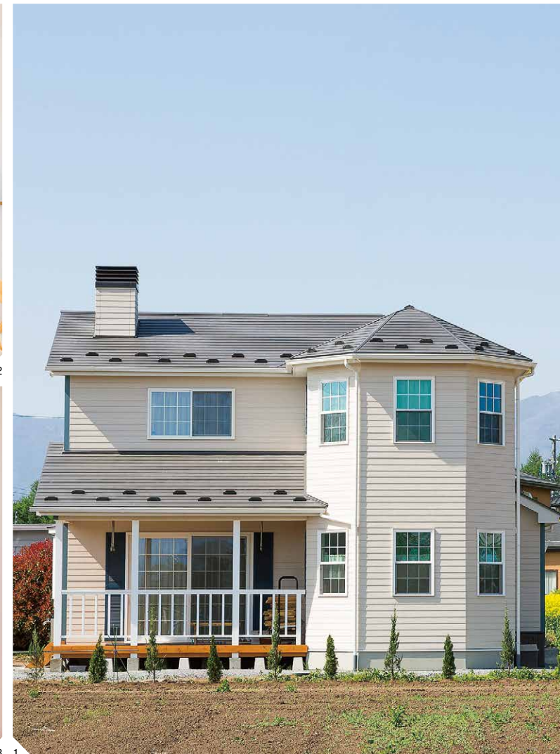
1.2階までそびえる多角形のタワーが、遠くからでもひととき目を引くS邸の外観。板張り風のサイディングに格子窓、デッキを覆うポーチの白い柵や柱が、のどかな風景に映える。この仕様で本体価格1,800万円台!! 2.ダイニング側から手元を隠せるよう、カウンターに立ち上がりをつけたキッチン。波のような曲線が可愛い食器棚は、家の雰囲気に合ったものを探して購入した。左手のアールの下がり壁の向こうがリビング 3.多角形のバルコニー部分はダイニングルーム。家の東南面にあるので、朝日がたっぷり降り注ぐ気持ちいいスペースだ。窓下に設置したカウンターは、ご主人のアイデア。出っ張った奥行きのある分、小物のディスプレイなどにぴったり!