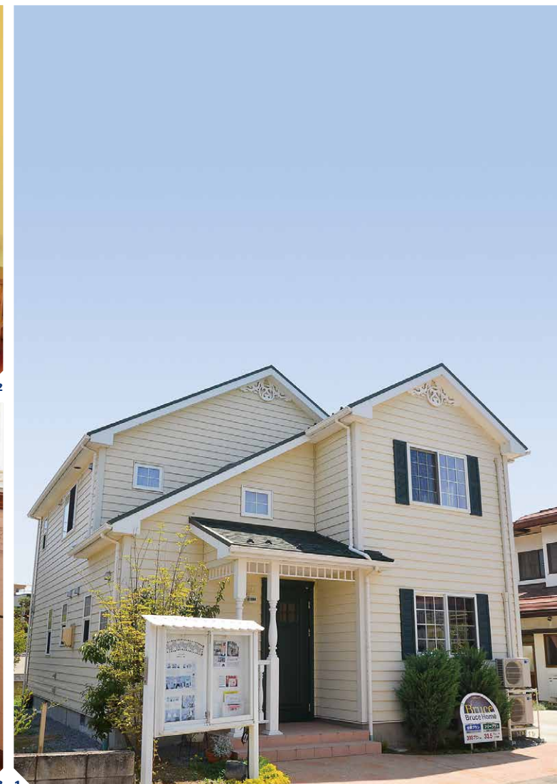
【長野市稲里モデルハウス】1.人気のオレゴンシリーズをベースとしたモデルハウス。英国の住まいをルーツとする北米スタイルと威風堂々とした佇まいはあたたかさに包まれたテイスト。グリーン屋根と質感の高いラップサイディングは一見の価値あり 2.寝室にもテーマカラーのグリーンを取り入れ、家全体に統一感を。クローゼットの扉や室内ドアなど、標準で上質な仕様を提案 3.モザイクタイルとガラスを組み合わせた色彩鮮やかな洗面台。小物一つひとつのディテールにも凝っており「可愛い」が溢れている