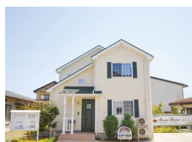
稲里モデルハウス

デザイン性と機能性を考えてある間取りになっております。可愛いインテリアも沢山ありますので、是非モデルハウスにお出かけ下さい。