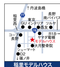
稲里モデルハウス