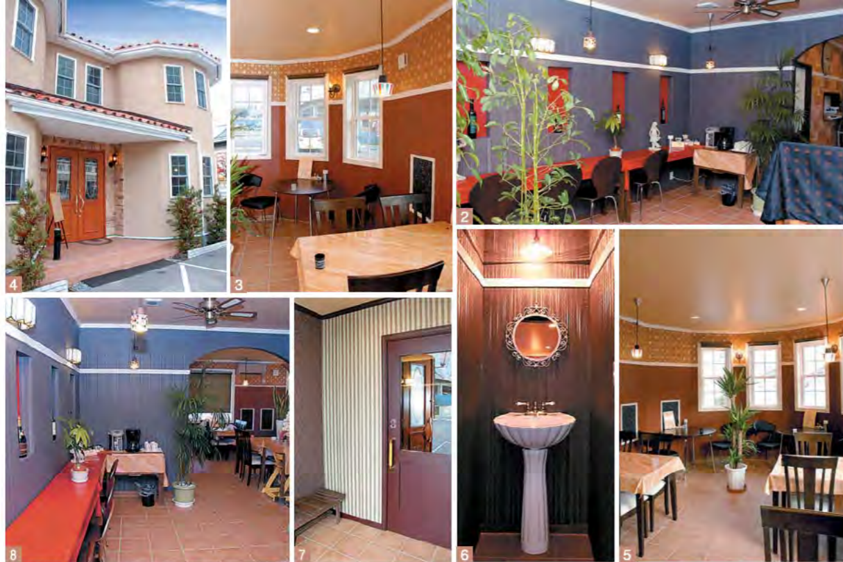
1.4.両サイドのパノラマウィンドーが印象的な外観 2.壁面を利用した小物置き場が印象的なカウンター席 3.落ち着いた雰囲気のある店内 5.明るく開放的なパノラマのフロア。壁紙も2層に分けて施工し、イギリスアンティークと宮廷文化の雰囲気を漂わせる 6.洗面台や鏡も店舗全体の雰囲気に合うよう、オーナーがセレクトした 7.待合スペースにも同社の技術が発揮されている 8.R開口の先は12席ほどの小規模パーティーができるフロアになっている 9.オーナーの遊び心で、トイレには金の天使を取り付けた 10.11.フロアに合わせてセレクトした照明器具。ほのぼのとした雰囲気