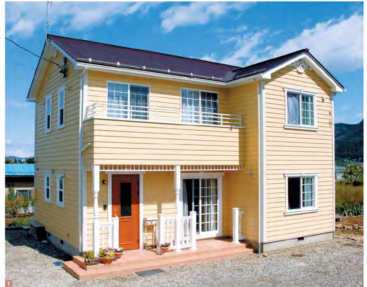
1.ブルースホームで施工した中野市のA邸