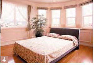
1.太陽と風がよく似合う南仏プロヴァンス風のモデルハウスの夜の雰囲気 2.リビングには開放的なパノラマウィンドー。柔らかな光が降り注ぎ、ゆっくりできる 3.照明にはヨーロッパ伝統のロートアイアのランプを使用 4.日の光が差し込む明るく広い寝室 5.タイル使いが南仏らしさを醸し出すキッチン。IHを搭載しているので料理や手入れがとても簡単 6.来客を優しく迎える玄関ホール 7.石積みアーチとアンティーク調の重厚な玄関ドア